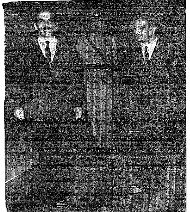
جلالة الملك العظيم وسمو الامير حسن العظيم لدى وصول جلالاته الى عمان مساء امس

وكان جلالة الملك الحسين العظيم قد غادر عمان في اليوم التاسع والعشرين من شهر نيسان الماضي في زيارة ليبيض دول أوروبا ، حيث واصل جلالاته خلال وجوده غيباً انصاته بعدد من قاداتها وزعمائها ، من اجل خدمة القضية التي رهبها نفسه ، وكرس لها كل جهده ، قضية الحق والمستقبل العربي .